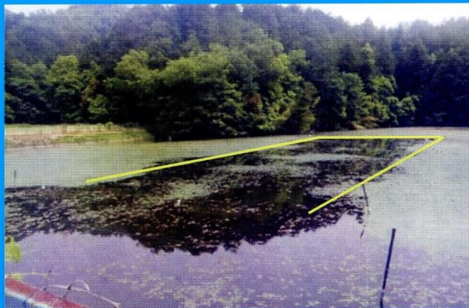
散布1年後発芽抑制